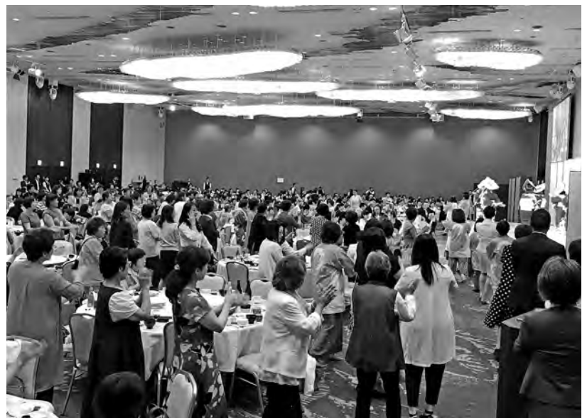
会場全体で佐渡おけさ

乾杯のご発声の後、新潟県女性連より歓迎の意を込めて、あてやかな着物をまとった二〇〇年の伝統を誇る古町芸妓の方々から踊りを披露していただきました。続いて、各都県連代表による情報発信及び出し物披露に移りました。最後に、来年度開催県である長野県から、来年度に向けてのPRが行われました。その後、会場の皆様全体で、「佐渡おけさ」を踊り、会場内では、おそろいのはつぴを着た、佐渡の女性部員の皆様から、ステージでは、相川町商工会女性部の皆様から「佐渡おけさ」をご披露いただきました。