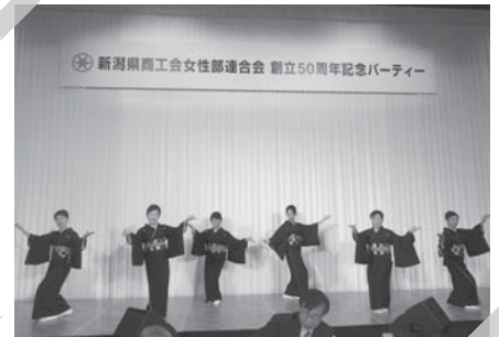
両津商工会女性部 芸妓舞