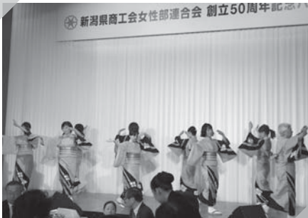
小出商工会女性部 小出小唄