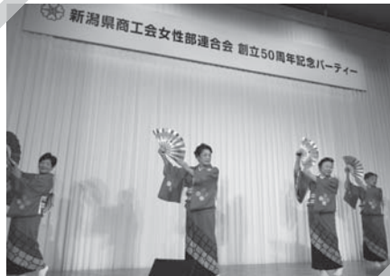
妙高高原商工会女性部 妙高山讃歌