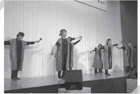
川口町商工会女性部 きよしのソーラン節