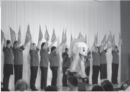
村松商工会女性部 Let's Dance! サクラナちゃん with 村松レディース