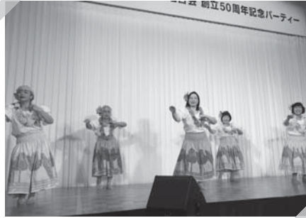
寺泊町商工会女性部 フラダンスチーム“ティリーフ”による ～キバフル～