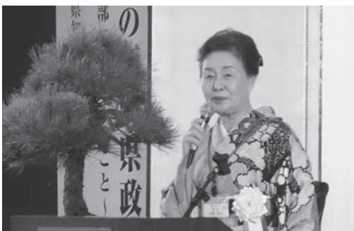
末武県女性連会長 大会会長挨拶