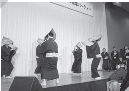
相川町商工会女性部 相川音頭