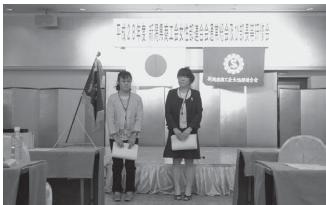
商工会カード加入促進運動表彰