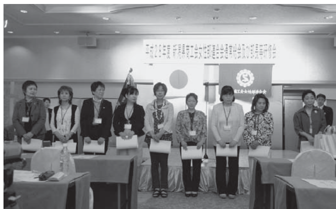
部員増強運動表彰

この度は、部員増強運動の受賞、誠にありがとうございます。私が部長になって初めての嬉しい出来事です。中越地震後、川口地域は人口が減少し続けていますが、その中で商工会女性部に入ってくれる方がいらっしゃるといふ事はとても嬉しい事です。これからも、部員で助け合い声かけあって明るい地域づくりに励みたいと思ひます。