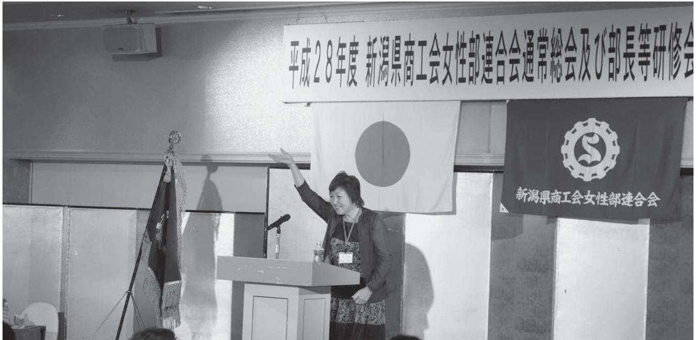
5月16日(月) 県女性連通常総会終了、女性部長等研修会が開催されました。 女性部主張発表大会では、県内6ブロックから選出された代表者6名から主張を発表して頂きました。