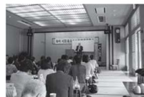
平成22年度交流集会 高柳町にて

黒姫商工会は、柏崎市の中に会議所と商工会が両方あるという特々な地域です。この事も含め部員減少が一番の問題です。現在女性部員は17名、交流集会、忘・新年会、花いっぱい運動等が主な活動です。交流集会は刈羽村、西山町、北条、高柳町、黒姫の5商工会で、年一回持ち回りで開催しております。黒姫の部員は少数ですが、交流集会等の時は、ほぼ全員が出席し、会を盛り上げてくれます。活動は微々たるものですが、継続は力なりと信じ、地域の元気は女性部員からと日々活動しています。