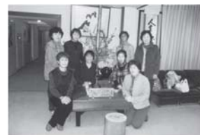
平成22年度忘年会 寺泊温泉 住吉屋にて